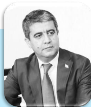
Дилшод САФАРЗОДА – муовини вазири маориф ва илми Ҷумҳурии Тоҷикистон

Аз омилҳои муҳиме, ки ба пешрафти мактабу маориф мусоидат мекунад, таъмини шароити фаъолият ва дастгирии молиявӣ ба шумор меравад. Ҳукумати Ҷумҳурии Тоҷикистон таҳти роҳбарии Асосгузори сулҳу ваҳдати миллӣ-Пешвои миллат, Президенти Ҷумҳурии Тоҷикистон, муҳтарам Эмомалӣ Раҳмон пайваста ба соҳаи маориф тавачҷуҳ зоҳир карда, масъалаҳои ҳалталабро мавриди баррасӣ қарор медиҳанд.